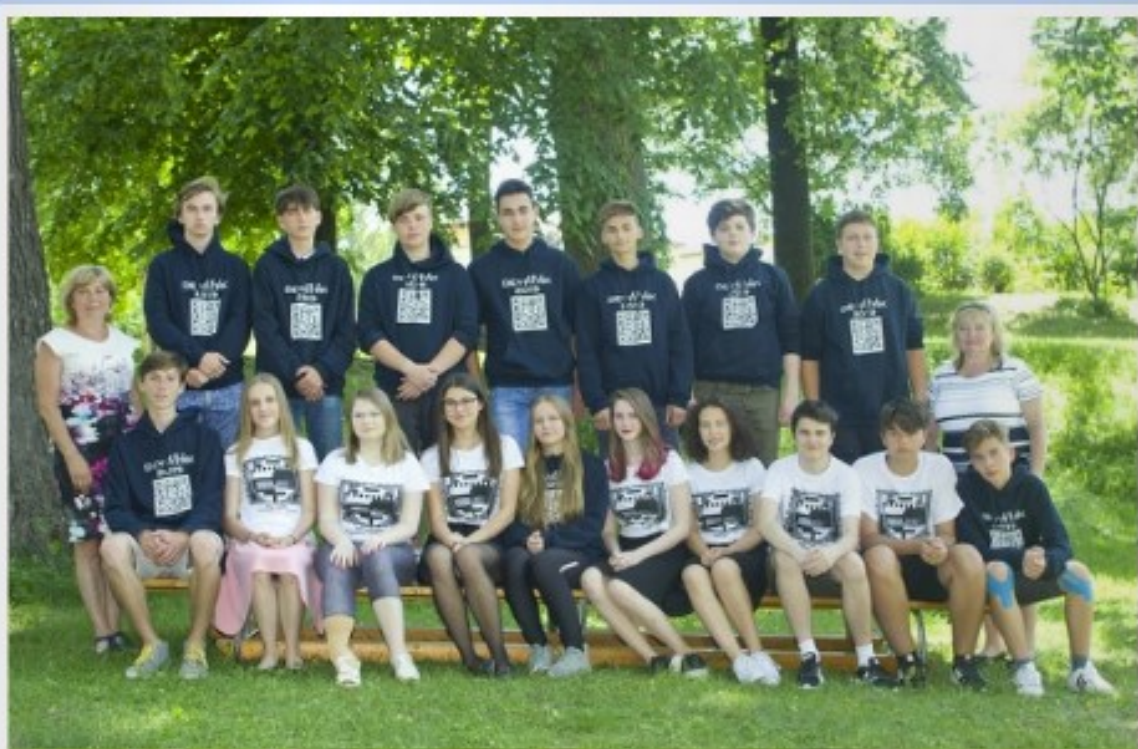
9.A ZŠ a MŠ Stará Ves nad Ondřejnicí 2018/2019