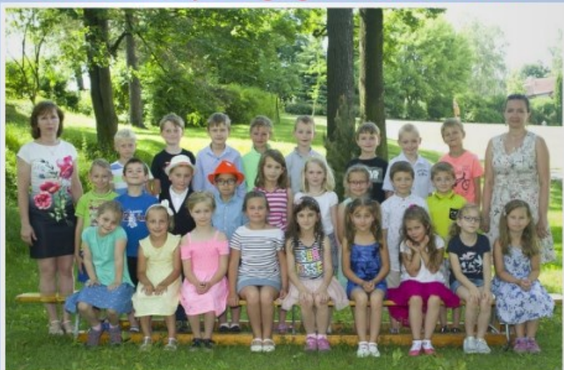
1.A ZŠ a MŠ Stará Ves nad Ondřejnicí 2018/2019