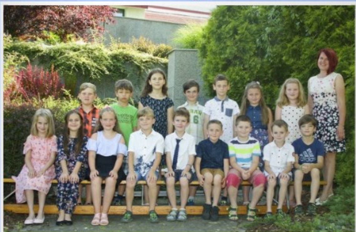
2.A ZŠ a MŠ Stará Ves nad Ondřejnicí 2018/2019