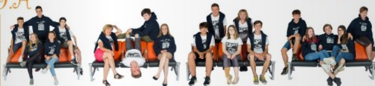
ZŠ a MŠ Stará Ves nad Ondřejnicí