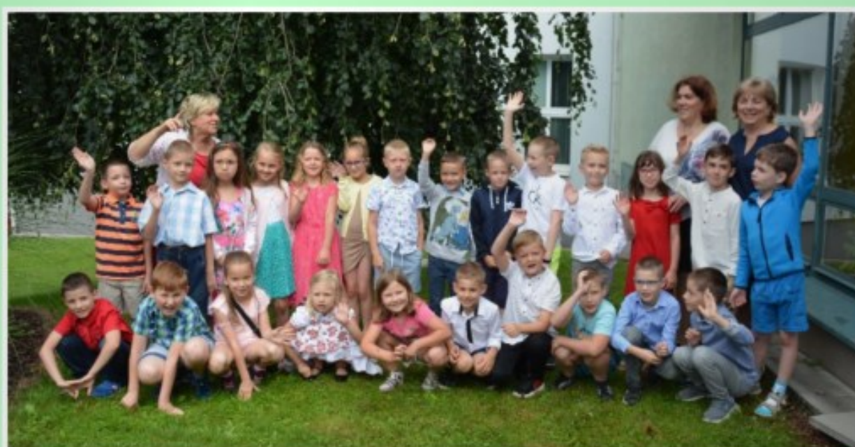
Prvňáčci první školní rok zvládli na jedničku.