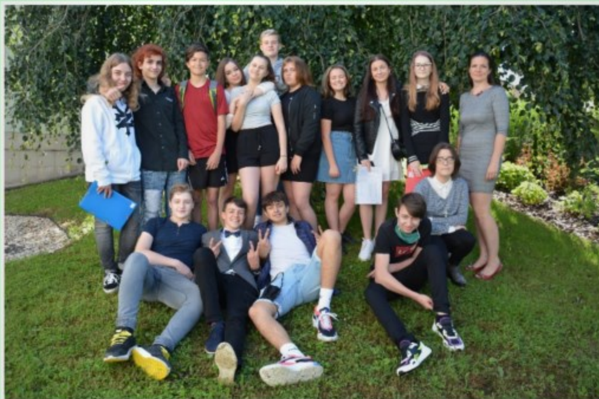
Osmáci přebírají štafetu žáků 9. třídy. Přejme jim bezkovidový rok!